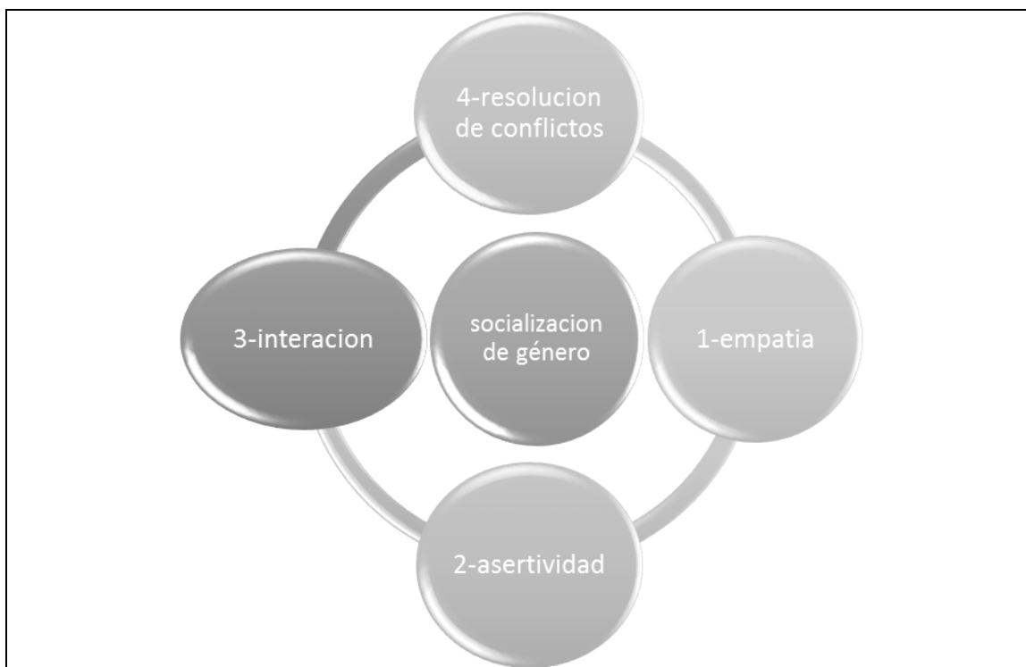
GRÁFICO DE LA SOCIALIZACIÓN DE GÉNERO Y SUS COMPONENTES

Este grafico corresponde a la variable dependiente que es la Socialización de Género que consta de cuatro componentes, el primero es la empatía que el estudiante podrá entender y comprender los diferentes puntos de vista, la segunda es asertividad que el estudiante podrá defender sus ideas de la mejor manera que considere, el tercero es la interacción que el estudiante se relacione con sus pares opuestos y el cuarto que es la resolución de conflictos, permitiéndole al estudiante comprender el conflicto de una situación y busca una solución para ello.